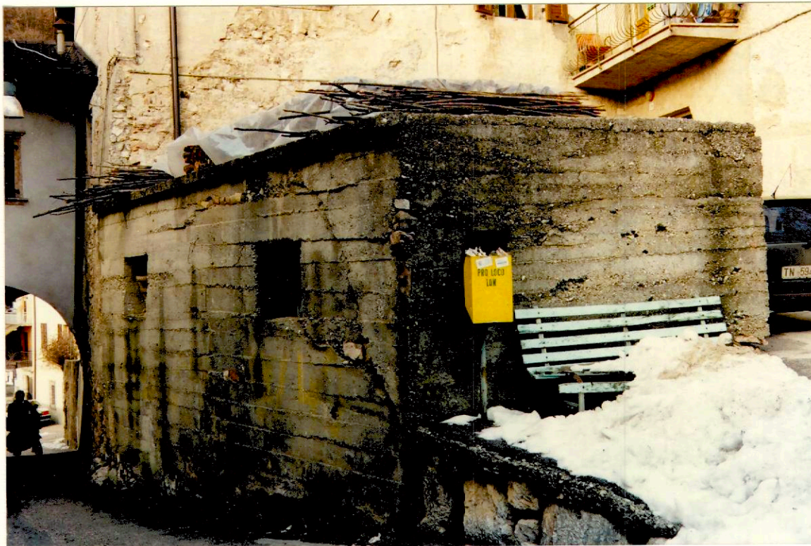
Documentazione fotografica - Immagine 2 (Rif.archivio:negativo__fotogramma__)